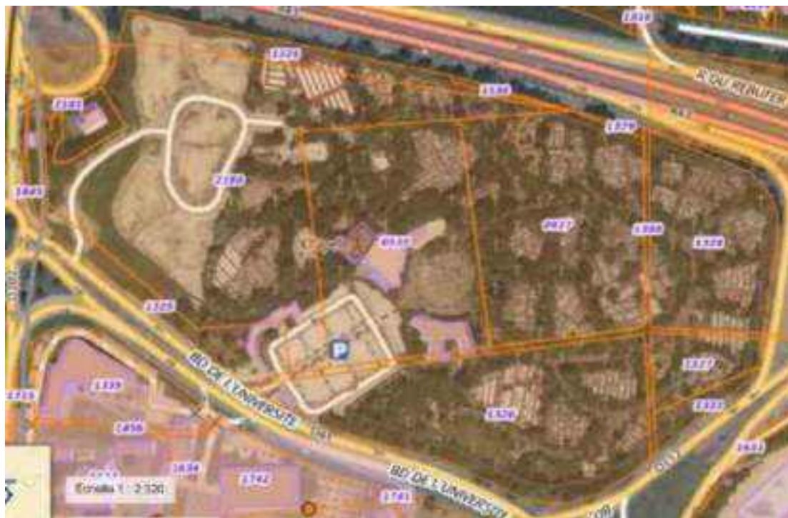
Plan cadastral

Le PLU-H de la Métropole la classe en zone naturelle N2. A ce titre, le projet convient de respecter le règlement de la zone qui autorise la construction d'installations et d'ouvrages nécessaires aux équipements d'intérêt collectif ou à des services publics à condition que l'augmentation de l'emprise au sol soit d'une surface d'au moins 30m 2 et ne dépasse pas 20% de l'emprise existante. Toutes les conditions semblent réalisées puisque l'extension qui concerne un ouvrage public d'intérêt collectif est de 205m 2 et l'emprise actuelle de 1110m 2 autoriserait un agrandissement jusqu' à 220m 2 .