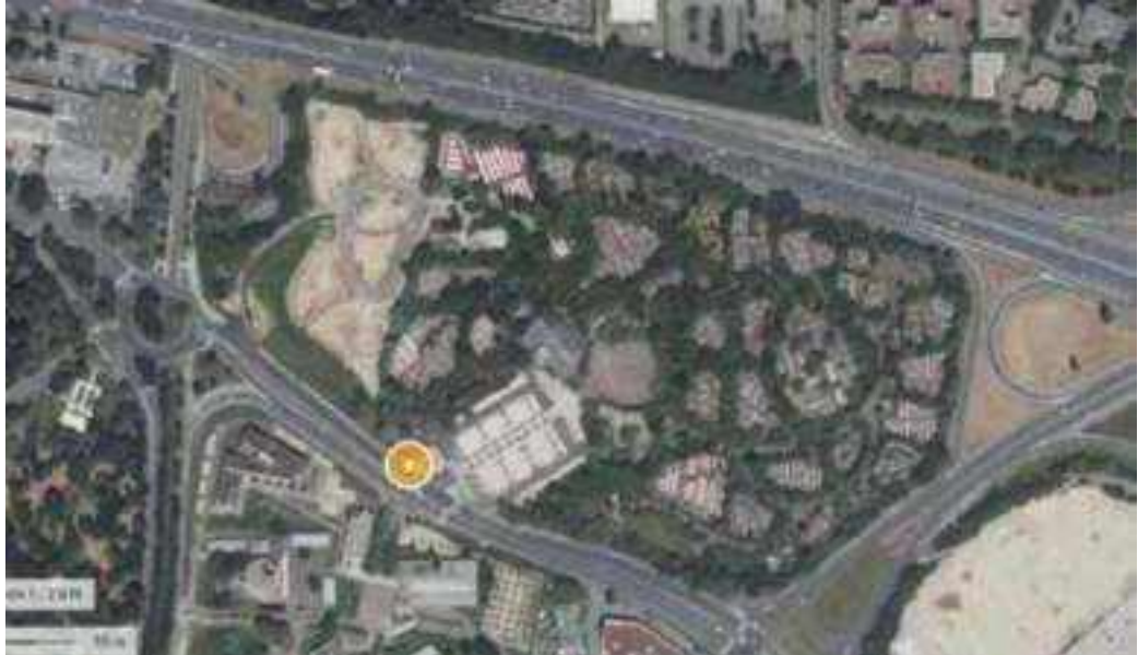
Situation parc cimetière de Bron

Les parcelles qui composent le parc s'insèrent dans un vaste ensemble cerné en majeure partie par des grands axes routiers et sensiblement éloigné des habitations, ce qui en fait un lieu privilégié pour ce type de services et qui n'offre pas de contradiction fondamentale à un projet d'extension de la partie crématorium.